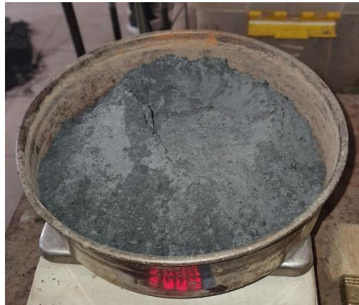
Gambar 3. Abu Serrabut Kelapa