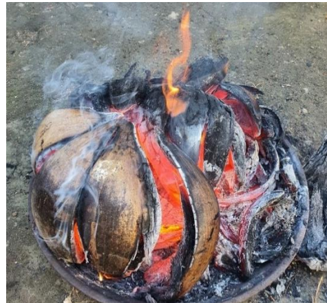
Gambar 2. Pembakaran Serabut Kelapa

Serabut kelapa dibakar menggunakan wajan tanah liat hingga menjadi abu yang halus.