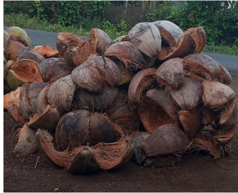
Gambar 1. Pengumpulan Serabut Kelapa