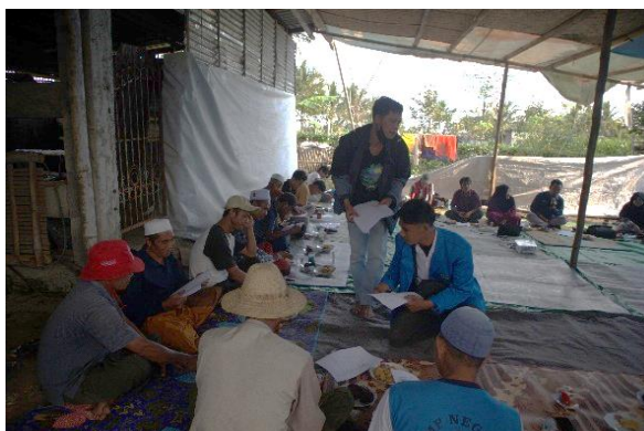
Gambar 2. Pembagian Pertanyaan Post Test Terkait Materi

Tim Pengabdian turut menekankan pentingnya penerapan prinsip pemisahan antara aset pribadi dengan kekayaan milik kelompok, guna mencegah terjadinya pencampuran dana yang dapat mempersulit proses pengawasan dan pengendalian keuangan kelompok. Selain itu, Tim juga memberikan penjelasan mengenai praktik manajemen keuangan yang ideal dalam konteks operasional Kelompok Tani Ternak Berlian. Beberapa langkah strategis yang dianjurkan mencakup: penyusunan sistem pembukuan keuangan yang terstruktur, pemisahan yang jelas antara aset individu dan kekayaan kelompok, perencanaan keuangan yang matang, pengelolaan arus kas yang efisien, serta evaluasi berkala terhadap laba atau kerugian yang diperoleh dari kegiatan usaha kelompok.