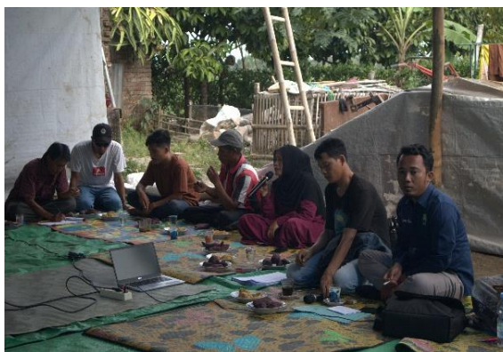
Gambar 1. Pemberian Materi Manajemen Administrasi Kegiatan

Tim Pengabdian juga menekankan urgensi pencatatan tamu melalui buku tamu, yang memiliki fungsi strategis dalam mendokumentasikan identitas individu atau pihak eksternal yang pernah melakukan kunjungan ke kelompok. Selain mencatat data pengunjung, buku ini juga memuat kesan dan saran yang dapat dijadikan umpan balik konstruktif dalam pengembangan kelompok. Di samping itu, dijelaskan pula pentingnya penggunaan buku notulen rapat, yang disusun oleh sekretaris kelompok untuk merekam seluruh hasil rapat secara sistematis. Informasi yang tercantum dalam buku notulen