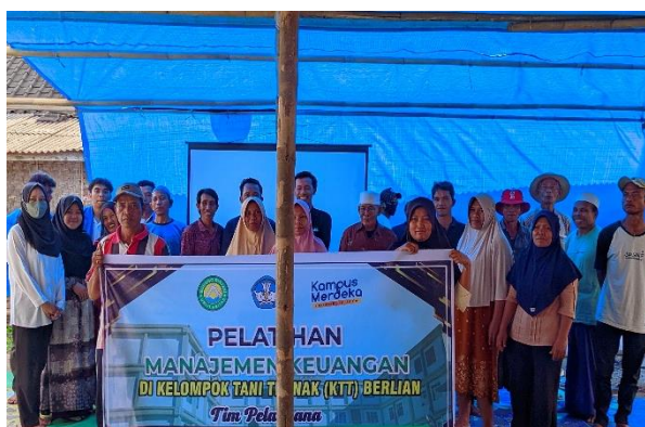
Gambar 4. Dokumentasi Kegiatan Pelatihan

Tim pengabdian menyerahkan bantuan kepada Kelompok Tani Ternak Berlian berupa : buku Kas, buku Inventaris, buku tamu, buku daftar anggota dan pengurus kelompok, buku daftar hadir anggota, buku notulen dan buku surat menyurat. Bendahara dan Sekretaris kemudian mengisi tiap buku yang diberikan yang disesuaikan dengan format isian sesuai arahan dari Tim Pengabdian. Pasca pelatihan tim pelaksana pengabdian juga melakukan pendampingan untuk lebih memperdalam pemahaman dan keterampilan peserta pelatihan khususnya bendahara dan sekretaris kelompok dalam melakukan pencatatan keuangan terkait dengan Buku Kas, buku inventaris dan buku penjualan. Kelompok Tani Ternak Berlian juga telah melakukan pencatatan notulen kegiatan, membuat daftar hadir peserta, membuat buku tamu dan membuat daftar anggota dan pengurus. Berdasarkan pantauan dan monitoring, Kelompok Tani Ternak Berlian sudah memiliki buku administrasi kegiatan dan keuangan serta laporan keuangan sederhana.